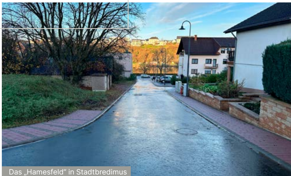
Das „Hamesfeld“ in Stadtbredimus

Auf Anregung des Innenministeriums werden verschiedene Anpassungen an den neuen internen Vorschriften vorgenommen.