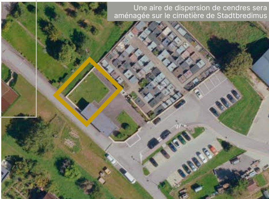
Une aire de dispersion de cendres sera aménagée sur le cimetière de Stadtbredimus

En outre, les taxes y relatives ont été refixées et peuvent être consultés sur le site internet communal www.stadtbredimus.lu ainsi qu'auprès du secrétariat communal.