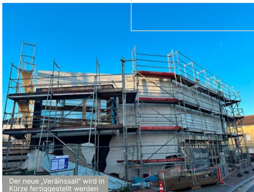
Der neue „Veräinssall“ wird in Kürze fertiggestellt werden

Nach Erhöhung des Anstellungsgrads des Gemeindegesekretärs auf 75% wird Frau Sylvie STEPHANY-MEYERS auf besagten Posten genannt.