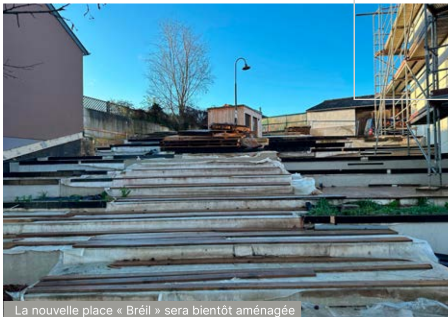
La nouvelle place « Bréil » sera bientôt aménagée