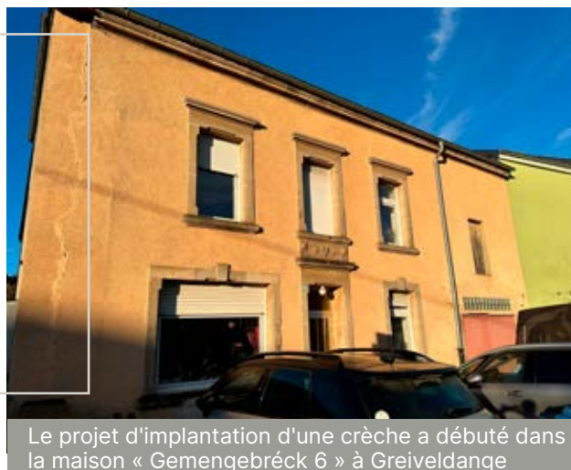
Le projet d'implantation d'une crèche a débuté dans la maison « Gemengebréck 6 » à Greiveldange

Les conseillers approuvent les demandes de morcellement d'une parcelle située au lieu-dit « Dicksstrooss » à Stadtbredimus.