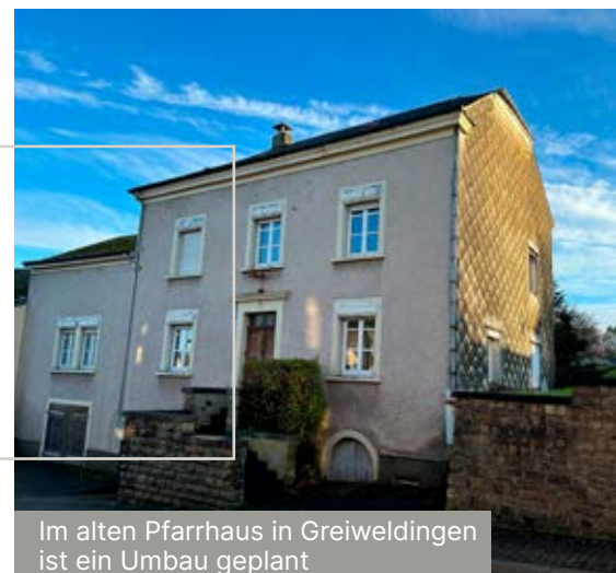
Im alten Pfarrhaus in Greiweldingen ist ein Umbau geplant

Die Gemeinde verzichtet auf ihr Vorkaufrecht auf verschiedene Grundstücke in der Flur „Hamesfeld“ in Stadtbredimus (C. STRONCK und C. FORGET haben den Sitzungssaal verlassen) und „Réipefeld“ in Greiweldingen.